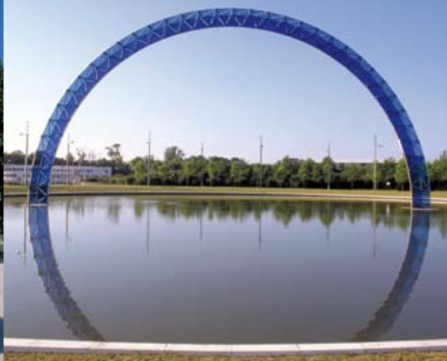
L'Arche de Piotr Kowalski. Centre-ville. (Montigny-le-Bretonneux). La construction tardive du centre-ville marquera l'apogée de la commande publique dans la ville nouvelle avec les interventions coordonnées sur le thème de l'eau.