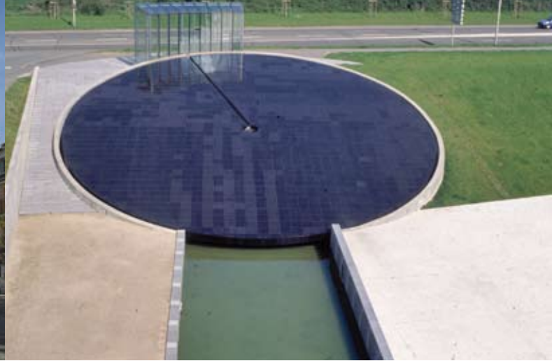
Meta et Espace Meta, Nissim Merkado, Les Prés/Centre-ville. (Montigny-le-Bretonneux). Cette œuvre évoque, avec cette météorite symbolisée par un disque de granit, la naissance des Sources de la Bièvre. L'œuvre interroge aussi notre rapport au temps, à la mémoire, à la genèse de la vie.