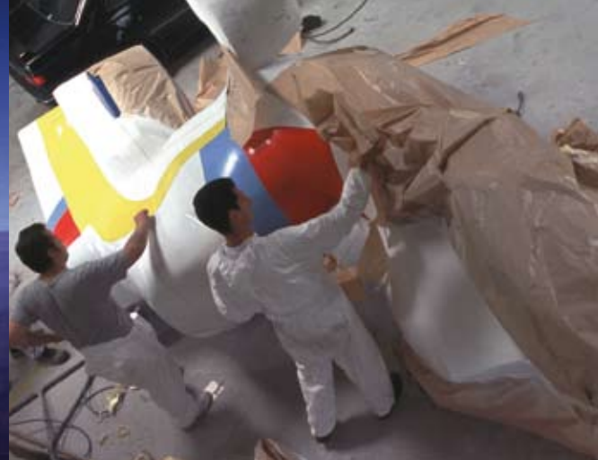
Restauration de Réflexion d'espace discontinu dit le « Mickey », Michaël Grossert, Parc des Coudrays (Elancourt). Souvent les techniques de restauration sont à inventer en lien avec le côté expérimental des matériaux des années 70. Ici la sculpture en polyester et fibre de verre est restaurée chez un carrossier d'Elancourt.