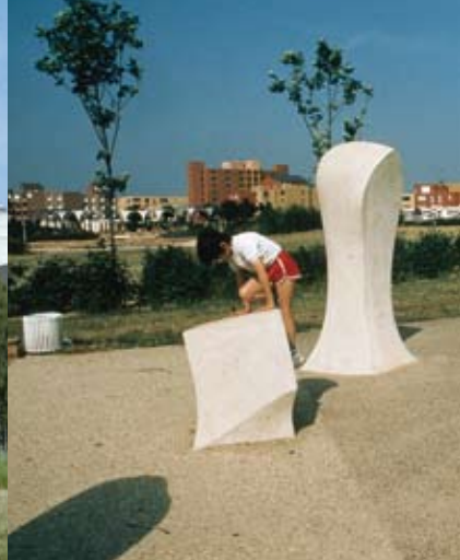
Sculpture béton (1991) Irmgard Sigg, Plaine de Neauphle (Trappes). Chaque quartier sortant de terre sera l'occasion de commandes publiques qui marquent leur époque et tentent de nouvelles expérimentations.