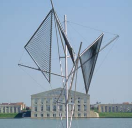
Voilure , Marcel Van Thienen, Grande Ile (Voisins-le-Bretonneux). Conçue avec des matériaux de navigation pour résister aux vents, la sculpture produit des vibrations lorsque le vent s'engouffre dans ses filets d'acier.