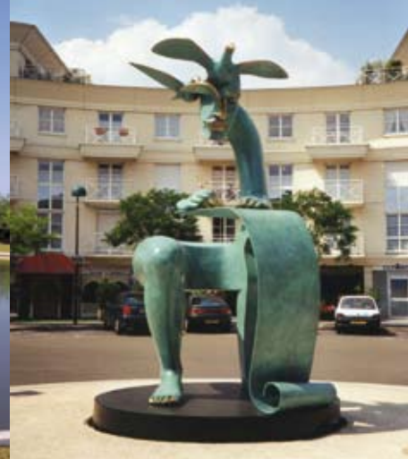
Paul Claudel, Bronze d'Etienne, Plan de Troux (Montigny-le-Bretonneux). Ce bronze marque le retour de l'initiative des communes dans la commande. Un style figuratif souvent mieux compris du public.