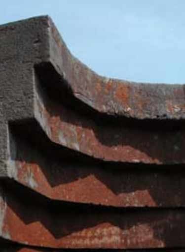
Fonte n°1 , Nicolas Sanhes, Orly Parc (La Verrière). Le choix du matériau constitue déjà un langage artistique, une ADN des sculptures et de nombreuses œuvres sont nommées comme tel : Fonte n°1 , Inox , IPN IV...