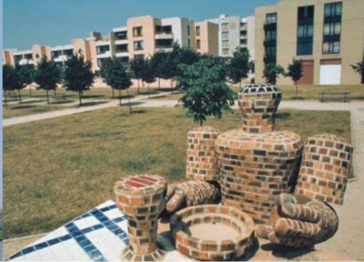
La Table des Géants , Klaus Schultze, 1% du Lycée Hôtelier, Le Parc (Guyancourt). La brique de Vaugirard et les émaux colorés signent l'œuvre de cet artiste qui a également réalisé un géant dormant aux 7 Mares, intitulé La Main divine .