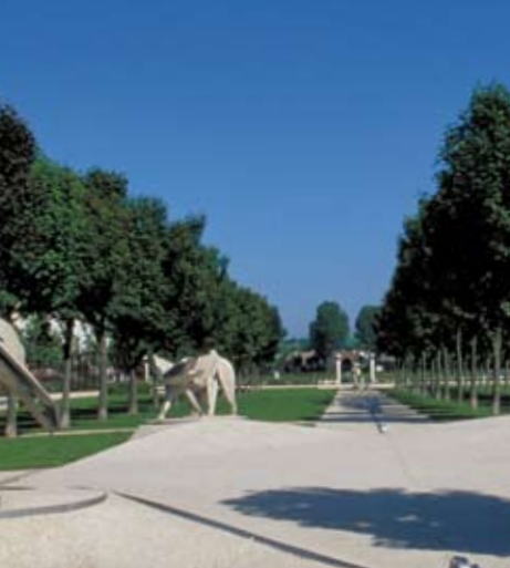
Les Gogottes, Tloupas Philolaos, Villaray (Guyancourt). Ces animaux fantastiques inventés par Tloupas Philolaos, s'arriment à un ruban d'acier qui souligne l'axe de composition et les perspectives de ce nouveau quartier.