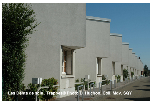
Les Dents de scie, Trappes

Que diriez-vous d'un voyage insolite ? Un voyage dans le temps, l'espace et les formes... A deux pas de chez vous...Nul besoin de passeport, votre curiosité et votre envie seront votre sésame. Nulle crainte de décalage horaire mais dépaysement garanti ! Les 17 et 18 septembre en effet, le Musée de la ville de Saint-Quentin-en-Yvelines, associé à de nombreux partenaires, vous invite à voyager au cœur du patrimoine.