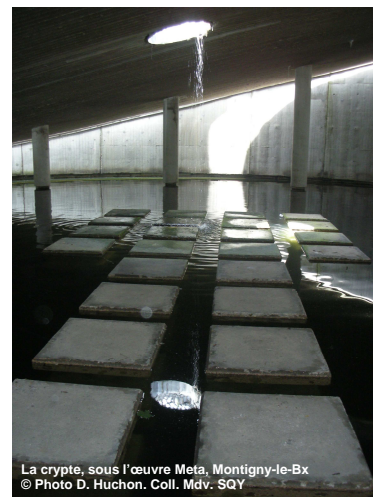
La crypte, sous l'œuvre Meta, Montigny-le-Bx

Le samedi 17 et le dimanche 18 septembre , venez vivre un long et riche voyage dans l'histoire, l'art et l'architecture qui vous conduira des Chevaliers du Temple aux artistes contemporains du street art, exposés à la Commanderie des Templiers de la Villedieu.