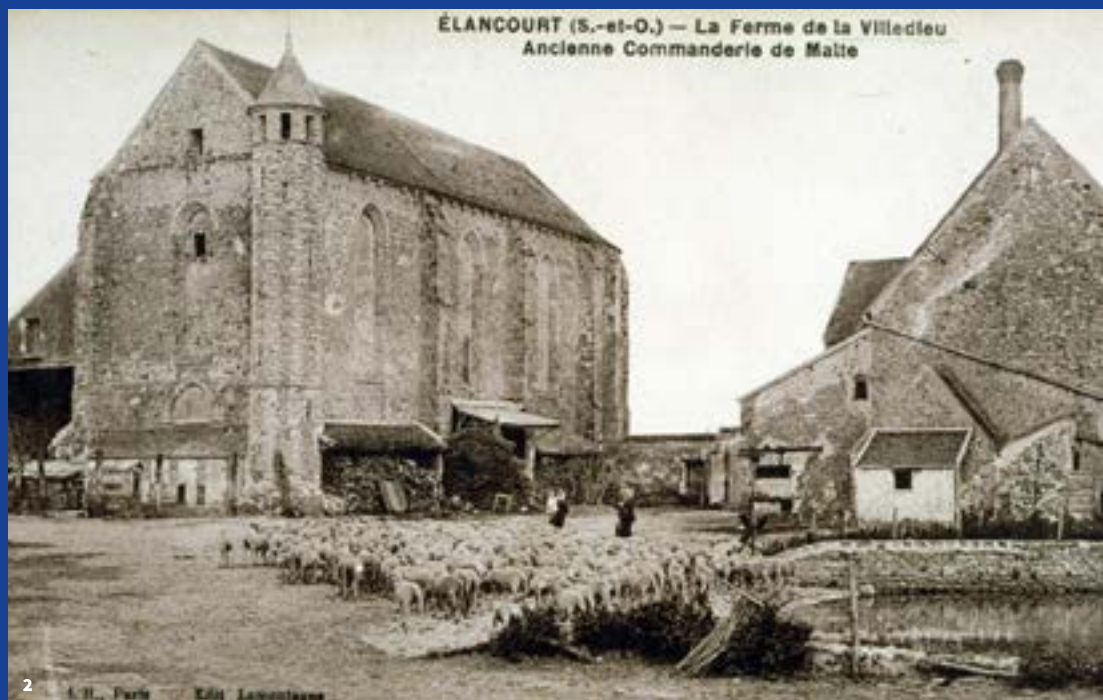
1. ÉLANCOURT (S.-et-O.) - La Ferme de la Ville-Dieu, carte postale colorisée du début du XX e siècle.