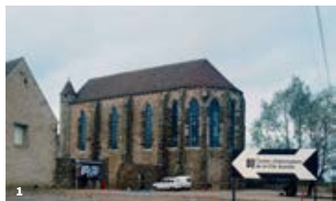
1. Le Centre d'information de la Ville Nouvelle à la Commanderie, 1974. L'EPA installe son premier office d'information à destination des futurs habitants de Saint-Quentin-en-Yvelines dans ce lieu emblématique du point de vue de l'histoire du territoire.

APRÈS LE DÉPART DU DERNIER OCCUPANT DE LA FERME, LES BÂTIMENTS SONT OUVERTS À TOUS LES VENTS, LAISSÉS À L'ABANDON ET À LA MERCI DES INTEMPÉRIES ET DES PILLEURS. POURTANT, LA VILLEDIEU VA ÊTRE SAUVÉE POUR DEVENIR UN CENTRE CULTUREL.