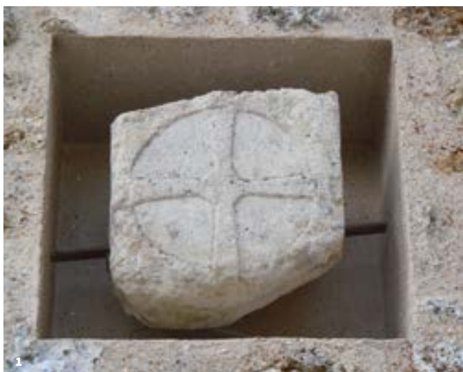
1. Croix templière. Cette pierre de grès taillée en croix pattée, emblème des Templiers, est retrouvée lors de la restauration du site dans les années 1970. Elle orne aujourd'hui la façade du bâtiment de Bièvres.