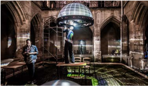
en séance de réglage