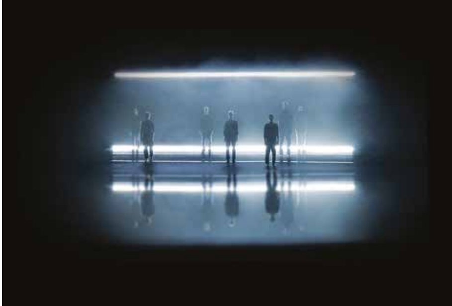
Arcadie © Cie La Vouivre