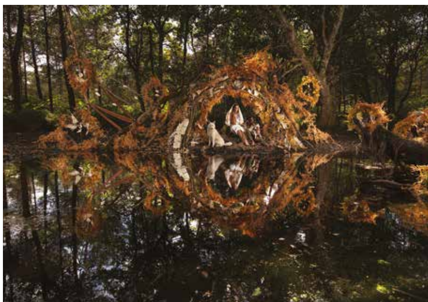
Cabanes imaginaires