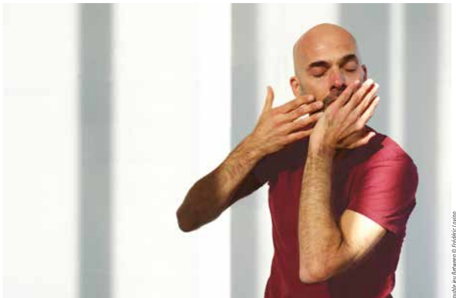
Double jeu Between

Tarifs : 7€ - 4€ (SQY) / 9€ - 6€ (hors SQY) Sur réservation