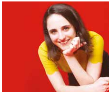
Maud Ventura © Édition L'Iconoclaste

Retrouvez Maud Ventura, autrice du roman à succès Mon mari pour ce nouvel épisode d' Au fil des mots . Maud nous fera l'honneur de se balader au sein des rayonnages de la médiathèque du Château, à Plaisir, afin de nous partager ses coups de cœur et nous raconter ses anecdotes !