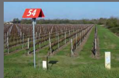
Différents types de bornes repérant les canalisations de transport