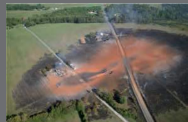
Conséquences d'une fuite sur une canalisation de transport, Appomatox (USA), 14 septembre 2008.