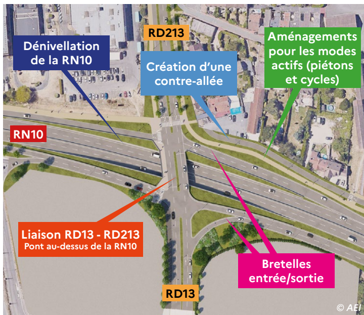
Schéma des principes d'aménagement