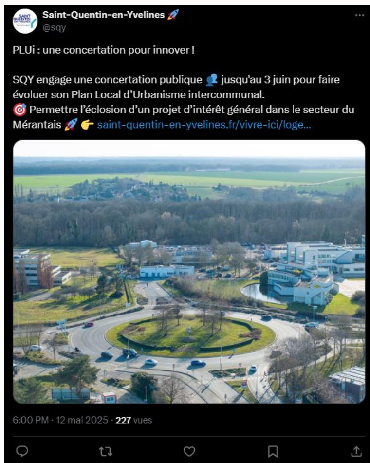
Capture d'écran de la publication réalisée sur le compte X (ex-Twitter) de SQY en date du 12 mai 2025 : https://x.com/sqy/status/1921958547627340149