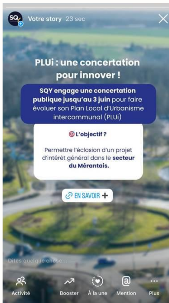
Capture d'écran de la story réalisée sur le Facebook de SQY en date du 13 mai 2025