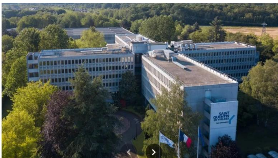
La communauté d'agglomération de Saint-Quentin-en-Yvelines avance sur le projet de quartier dédié à la recherche à Magny-les-Hameaux.